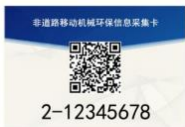
图 2 采集卡正面样式